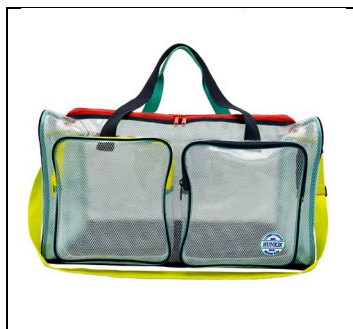
HUNIOX BEACH BAG