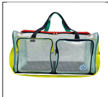
Sac de plage